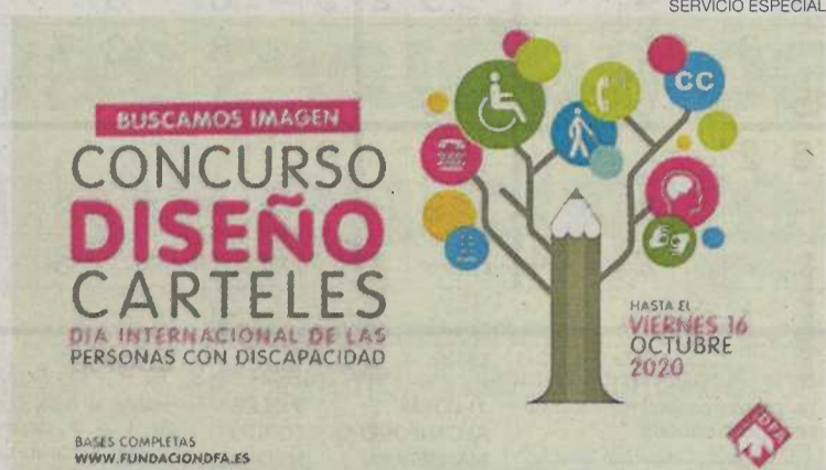
►► Cartel de la convocatoria del concurso

Un año más, Fundación DFA convoca el concurso de carteles Buscamos Imagen . El cartel ganador será la imagen de la campaña de sensibilización del día 3 de diciembre, Día Internacional de las Personas con Discapacidad. Los trabajos pueden ser fotografías, ilustraciones o composiciones diseñadas mediante cualquier tipo de técnica creativa, siendo requisito indispensable que sean obras originales, relacio-