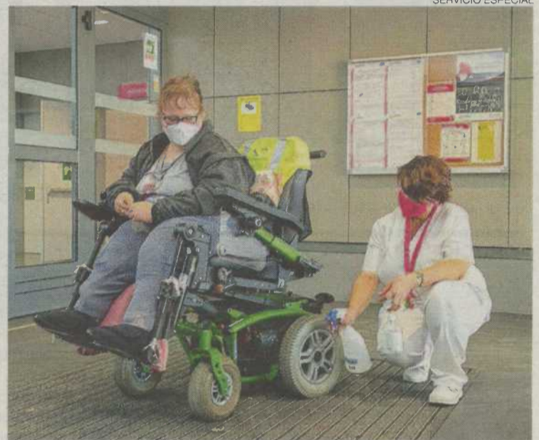
►► Todos los servicios se han adaptado para garantizar la seguridad.

También van a dar comienzo diferentes cursos en los Centros de Formación, con cursos para la empleabilidad de personas en situación de desempleo y ocupadas, en modalidad presencial y teleformación. Además, a mediados de septiembre también comienzan los Programas de Cualificación Inicial (PCI) dirigidos a jóvenes con discapacidad, apostando por la presencialidad cuando sea posible; así como la Formación Inicial para Personas Adultas (FIPA) en la que se